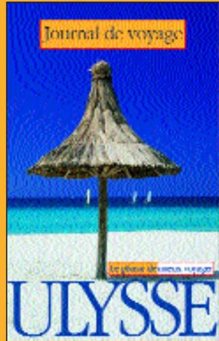
Journal de voyage La Plage 12,95 $ – 12,99 €

Pour le plaisir... de mieux voyager, n'oubliez pas votre JOURNAL DE VOYAGE