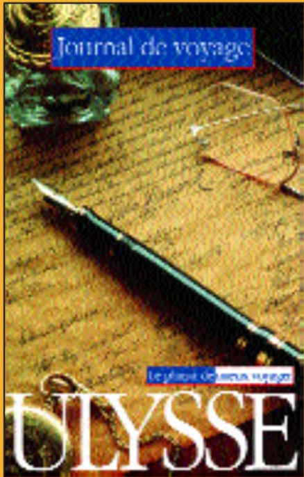
Journal de voyage L'Écrit 12,95 $ – 12,99 €