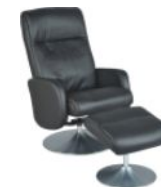
Fauteuil confortable relax manuel pivotant + Pouf LE ZAPPEUR (Cuir)