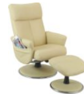
Fauteuil confortable relax manuel pivotant + Pouf L'ÉLÉGANT (Cuir)