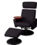
Fauteuil confortable relax manuel pivotant + Pouf LE BOBO (Cuir)