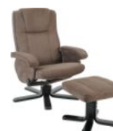
Fauteuil confortable relax manuel pivotant + Pouf KOKOON (Simili cuir /