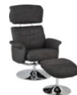
Fauteuil confortable relax manuel pivotant + Pouf COOL (Simili cuir, Tissu)