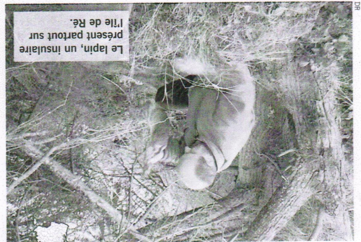
Le lapin, un insulaire présent partout sur l'île de Ré.

Les populations de lapins de garenne explosent dans l'Île de Ré. Le plan de gestion associant ACCA (Associations communales de chasse agréées), communes, exploitants agricoles, et le GAD (Groupeement agricole de développement durable) instauré en 2011, a été durci cette année. La Communauté de communes a affecté un budget de 80 000 € pour favoriser des opérations de furetage et l'aménagement de onze sites sinistrés.